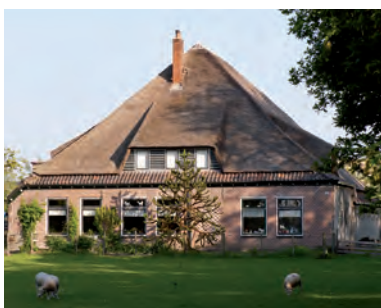
Jan Glijnisweg 25