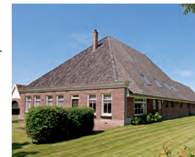
Jan Glijnisweg 57

Deze boerderij heette vroeger 'Rustenburgerhof'. De hoeve is al vóór 1832 gebouwd. Nog eerder stond hier al een boerderij die 'Kranenbosch' heette. Hij werd zo genoemd omdat aan de overkant van deze weg het Craner Bosch lag. Achter deze boerderij is een extra huisje aangebouwd. Zo'n aanbouw aan een stolpboerderij wordt 'staart' genoemd. Hier werd het vee geplaatst dat niet meer in de stolp paste. Bijzonder aan deze boerderij zijn de T-schuifvensters in de houten kozijnen, de sterankers en de houten kroonlijst. Deze bouwstijl wordt neo-rennaissance / jugendstil genoemd.