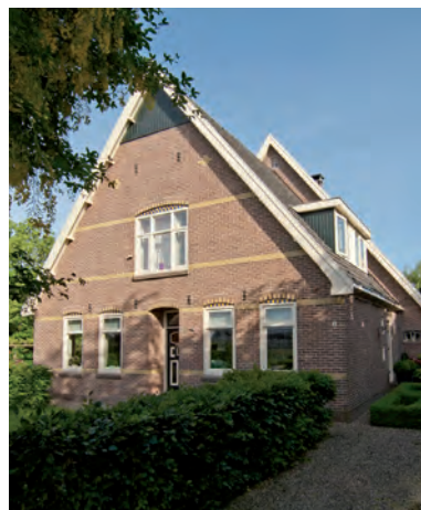
Jan Glijnisweg 15

Dit is een vrijwel gaaf gebleven kop-romp-boerderij uit 1925. De boerderij werd gelijktijdig met een identieke boerderij op Jan Glijnisweg 13 gebouwd. Dit gebeurde in opdracht van een landbouwer voor zijn twee zonen. In de jaren '70 is de rechterzijgevel van de stal vernieuwd. Hierin zijn drie oorspronkelijke getoogde gietijzeren stalvensters aangebracht. Ook binnen in de boerderij is de indeling nog vrijwel onaangetast.