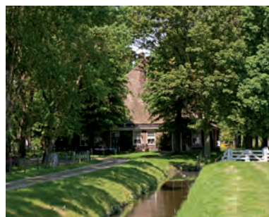
Jan Glijnisweg 27A

Dit is een deftige boerenplaats waar Heerhugowaard trots op is. Er is een lange oprit. Aan de voorkant zijn twee deuren. De ene deur is de entree, de andere is een schijndeur. Deze tweede deur zorgt ervoor dat er in de gevel een mooie verhouding is tussen ramen en deuren. De bomensingel en de gracht geven de stolp extra allure. Zo'n ruime situering van een stolp met erf komt verder niet voor in Heerhugowaard. In 1745 stond hier al een boerenwoning. In 1885 is de boerderij verbouwd en sindsdien is hij zo gebleven.